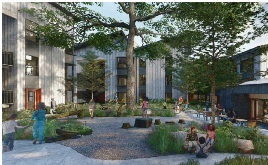
Representación de Verano Family Housing, un desarrollo de viviendas asequibles aprobado.

El Condado ha identificado 1.253 unidades en 14 proyectos que ya han sido planificados, aprobados o propuestos y que todavía no se han completado. De ellos, tres proyectos son 100% asequibles, 10 proyectos tienen algunas unidades asequibles y cuatro proyectos tienen únicamente unidades a precio de mercado.