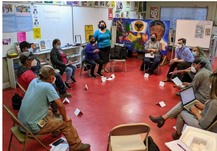
Grupo Focal en el Centro de Jornaleros Graton

o alquileres de vacaciones, y conciencia de los derechos de los inquilinos. Esta información se integró en todo el análisis de las necesidades y limitaciones de vivienda y se tuvo en cuenta al elaborar la Estrategia de Vivienda y el Plan de Acción. Los Apéndices del Elemento de Vivienda contienen más información sobre los esfuerzos de participación pública durante la actualización del Elemento de Vivienda.