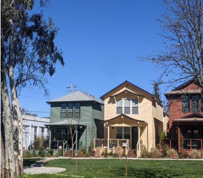
Dos casas de Hábitat para la Humanidad en Green Valley Village, 2019